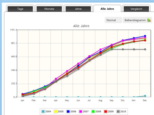
Comparación directo de su instalación por un período determinado