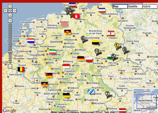
Mapa con todas las instalaciones de la base de datos

www.rendimiento-solar.eu es probablemente la más grande base de datos de rendimiento fotovoltaico internacional. Usted puede registrarse de una manera gratuita con su instalación, participar y, por lo tanto, ayudar al acierto de "rendimiento-solar". "rendimiento-solar" depara muchas comparaciones completas y estadísticas.