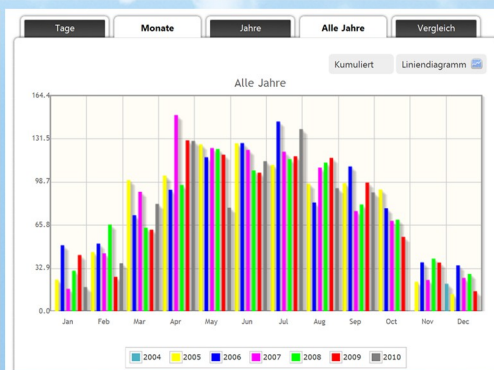
Comparación directo de su instalación por un período determinado